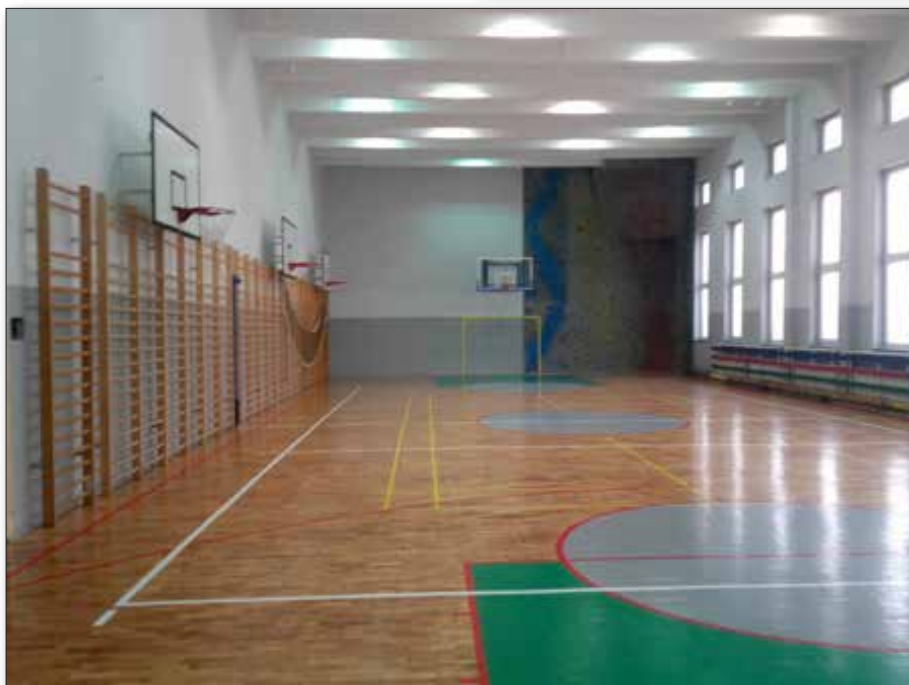
Sala Międzyszkolnego Ośrodka Sportowego po remoncie