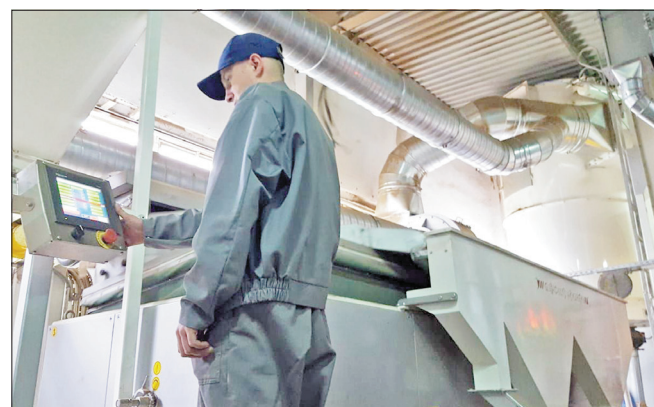
Hala produkcyjna w Olkuszu